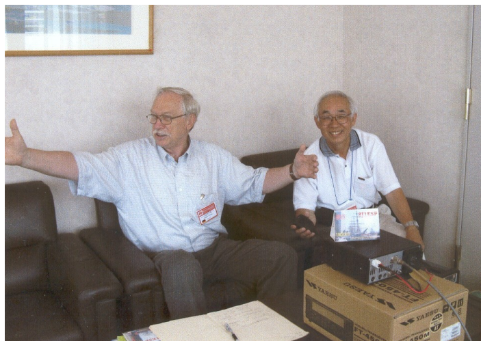
DJ4PG: Mi kaptis fiŝon tiel grandan!